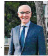
Thierry Repentin PRÉSIDENT DE L'ANAH

Pour réussir, l'Agence sait pouvoir compter sur l'engagement et la mobilisation des collectivités locales qu'elle accompagne dans la définition et le pilotage de leur politique locale de l'habitat privé, en mettant à disposition une expertise, des outils et des financements.